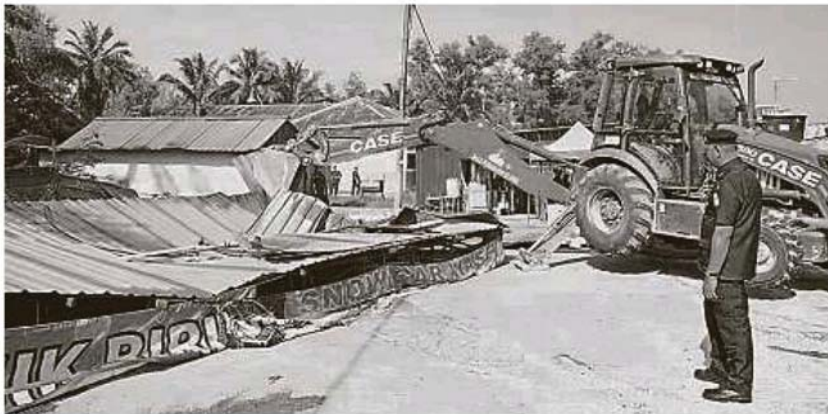
市议会执法组在警员的陪同下,动手拆除非法洗车店。