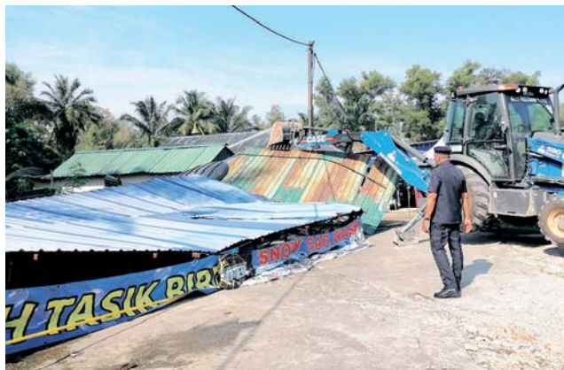
Struktur pusat cuci kereta dirobohkan selepas masih beroperasi walaupun dikenakan tindakan sitaan dan kompaun.

"Ya mengambil kira aspek kebersihan selain kawasan itu sepatutnya dijadikan tempat letak kereta awam kerana