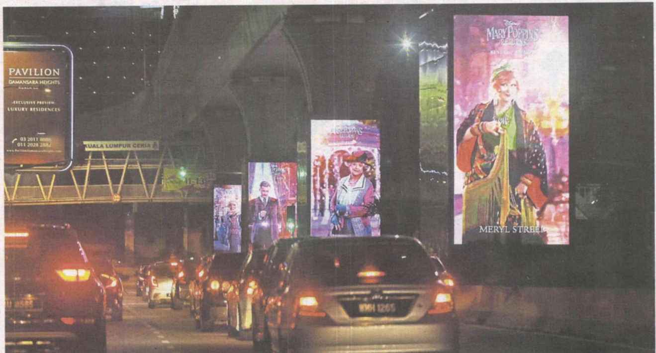
Next attraction: Digital billboards have become a common sight in the Klang Valley but many feel regulations are needed on their use.

Advancements in billboard advertising are welcomed but the new technology can be a trigger for those with epilepsy and autism, while also being a safety hazard. >2&3