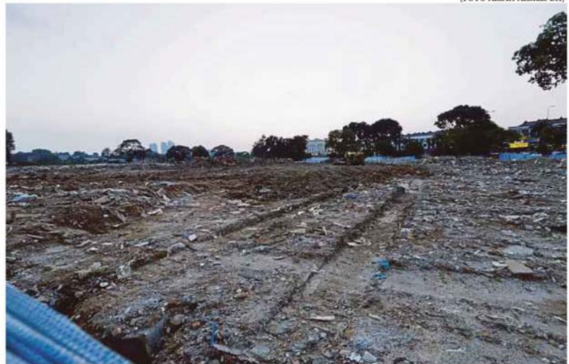
Bekas tapak kediaman anggota tentera Kem TUDM Kinrara yang sudah diroboh.