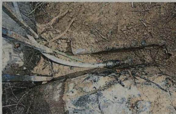
执法人员查获有人利用直径32毫米的HDPE水管接驳水供公司的主要水管偷水。

他呼吁民众察觉任何偷水事件，可主动向当局提供情报，而投诉者或提供情报者的资料绝对对保密。（TSI）