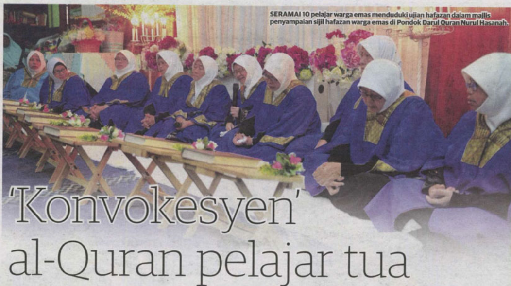
SERAMAI 10 pelajar warga emas menduduki ujian hafazan dalam majlis penyampaian sijil hafazan warga emas di Pondok Darul Quran Nurul Hasanah.

Usia bukan penghalang, sebaliknya kesungguhan dan iltizam tinggi menyaksikan 10 orang warga emas Pondok Darul Quran Nurul Hasanah berjaya menghafaz juzuk 30 dalam tempoh