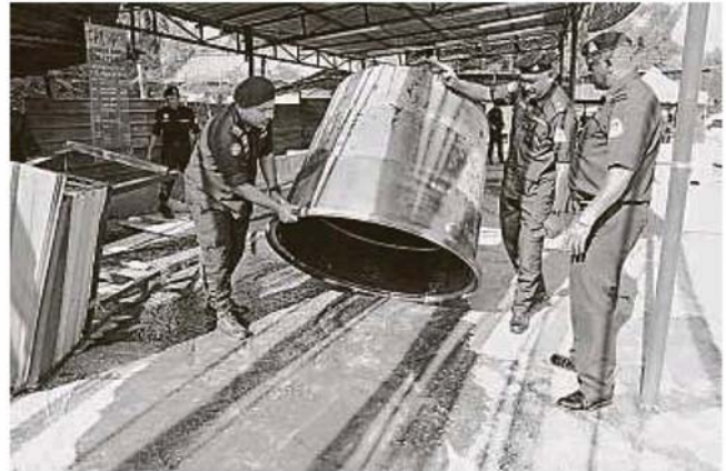
储水全被倒光,免得非法业者再伺机开业。

居民认为蓝湖是因为受到污染,而使自然景观与水源遭到破坏,使州政府促进旅游业的努力以及附近商民的收入惨受打击。根登蓝湖是轰埠著名的旅游区,因在天气晴朗时湖面呈如海洋般漂亮的宝蓝色而得名,亦是由政府举办的常年水上摩哆赛的主要场地。