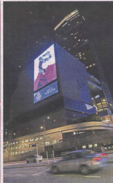
The brightness of digital billboards should be adjusted so that they are not so blinding.

at night especially in areas with such billboards because of the lights.