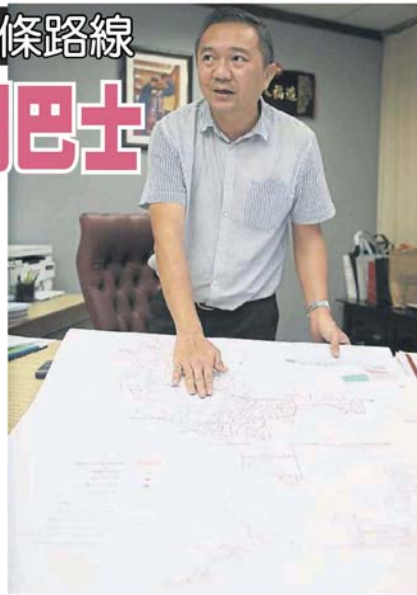
■八打靈再也的公共交通大藍圖，主要是針對公共交通系統。

(莎阿南21日訊)掌管雪州地方政府、公共交通及新村發展事務的行政議員黃思漢說，雪州政府將於今年繼續推動39條路線的雪州精明巴士計劃，為雪州人民提供免費巴士服務。