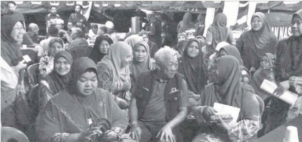
BUNG berbual mesra bersama jentera wanita BN dan Pas semasa perjumpaan itu.

Mengenai peluang BN memenangi PRK Semenyih, Bung berkata ia bukan perkara mustahil kerana rakyat mula sedar selama ini mereka hanya ditipu oleh kerajaan PH dengan janji palsu.