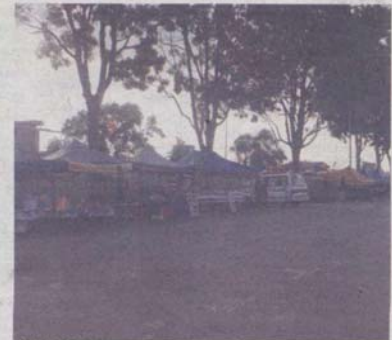
PENJAJA di tapak parkir awam berhadapan pasar raya besar Tesco Semenyih menghadapi kesukaran akibat tiada tapak khas menjaja yang disediakan MPKJ.