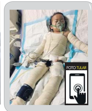
KeadAaan Azalea seperti ditularkan.

"Pihak LZS akan terus melaksanakan pemantauan terhadap keluarga ini dan bantuan zakat lain akan disalurkan berdasarkan kepada keperluan mereka bergantung kepada syarat dan kelayakan," katanya.