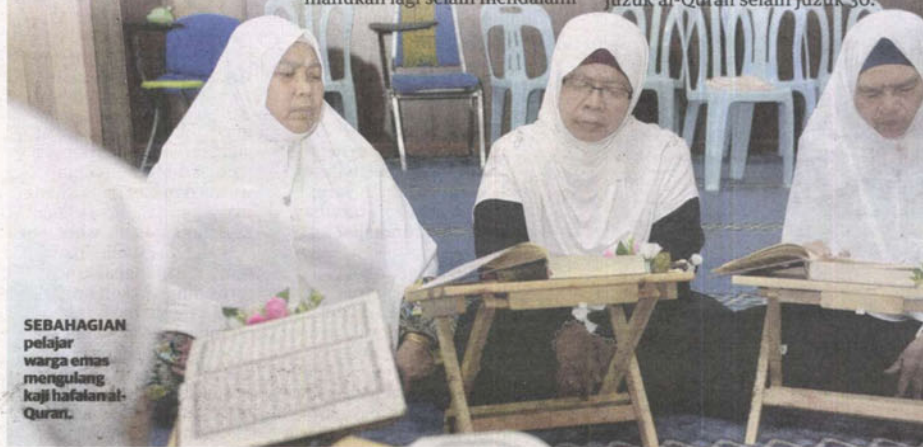
SEBAHAGIAN pelajar warga emas mengulang kaji hafalan al-Quran.

"Terima kasih banyak-banyak kepada pihak pengurusan Pondok Darul Quran Nurul Hasanah terutama kepada mudir dan tenaga pengajar di sini yang telah mengorbankan banyak masa kepada kami. Hanya Allah membalas jasa baik kalian," katanya penuh kesyukuran apabila sudah menghafaz dua juzuk al-Quran selain juzuk 30.