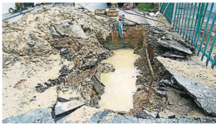
第8路“爆管街”水管爆裂的情况严重。