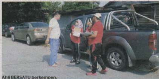
Ahli BERSATU berkempen.