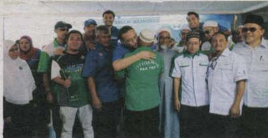
Pimpinan PAS dan BN di sekretariat kempen BN.