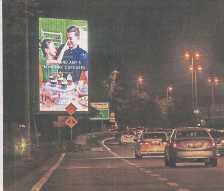
A billboard on the Damansara-Puchong Highway, heading towards Kelana Jaya.