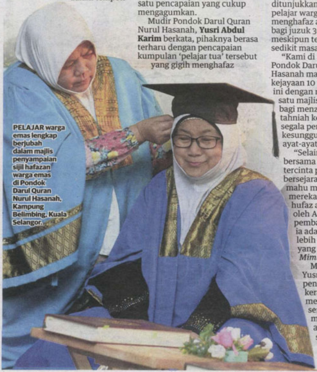
PELAJAR warga emas lengkap berjubah dalam majlis penyampaian sijil hafazan warga emas di Pondok Darul Quran Nurul Hasanah, Kampung Belimbing, Kuala Selangor.

"Pondok pengajian warga emas kedua ini telah siap 98 peratus dan dijangka beroperasi pada Mac ini. Alhamdulillah, ini merupakan satu kejayaan buat kami untuk meningkatkan lagi kecintaan orang ramai kepada Islam dan al-Quran," katanya yang turut mempunyai sebuah pusat tahfiz untuk anak-anak muda.