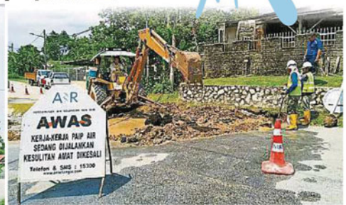
▲万撓新村第6路在元宵节(19日)当天爆水管后,隔天轮到第7路爆水管,而且连爆两处,对居民造成困扰。