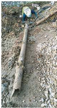
雪州水供公司水色商必须在马路上挖出大洞,才能找到破裂的水管。

据了解,万撓新村共有11条马路,当中仅有中路“幸免”于爆水管之难,其余的1至10路在过去均曾面对不同程度的水管爆裂状况,而每每当局修