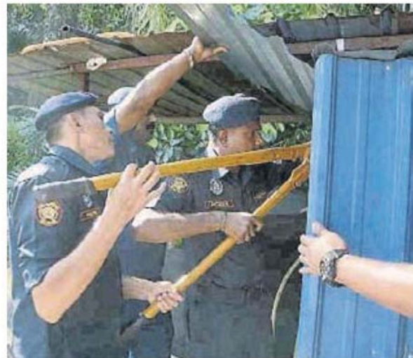
■ 执法人员动用铁剪拆除旁边的锌板结构。

他说，执法队伍也充公洗车中心内的设备，该建筑物被拆除，原有的地点将会使用停车位的用途。