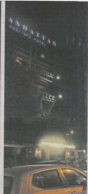
Digital billboards are under the purview of local councils. (Right) Motorists stuck in traffic in Damansara Perdana, probably welcome having their attention diverted by this digital billboard.

By SHEILA SRI PRIYA sheilasripriya@thestar.com.my