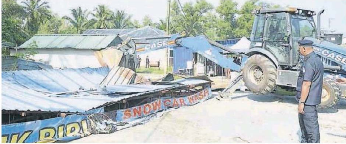
■ 士拉央市议会展开联合取缔行动，把非法洗车中心的建筑物拆除。

(士拉央21日讯) 士拉央市议会展开取缔行动，对付没有执照的洗车中心，也揭发洗车中心没有电表，不知从何处接驳水供。