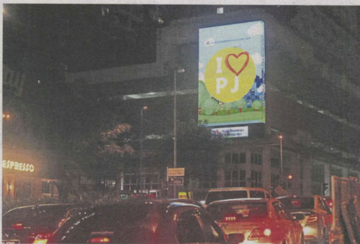
The eye-catching visuals displayed on digital billboards can cause motorists to shift their focus from the road.

MBPJ finalising guidelines on digital billboards as motorists complain about challenges of staying focused on the road