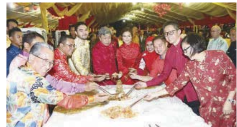
The royal family and the invited dignitaries tossing the yee sang.

"More and more companies have chosen Selangor to be their regional distribution centre in the Asia Pacific region. These are some of our proud achievements. I strongly believe that we will keep it up to ensure that Selangor always stays ahead," said Teng.